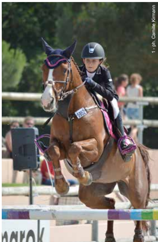
1 - ph. Camille Kirmann