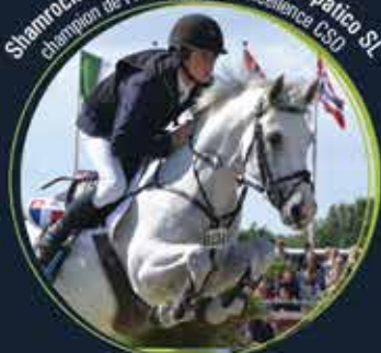
Shamrock du Gite, par Welcome Sympatico SL champion de France As Elite Excellence CSO