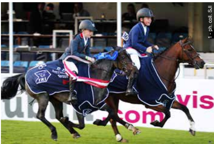
1 - ph. coll. SJI

“ Pour accéder à la catégorie supérieure, ils doivent à chaque fois avoir validé un crédit de point. Un poney « de Grand Prix » ne pourra pas être utilisé sur une petite épreuve, même avec un nouveau pilote. ”