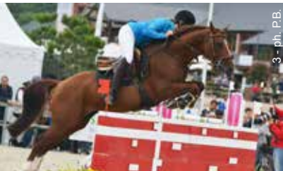
1 - Quabar des Monceaux (double champion d'Europe), 2 - Tricky Choice du Péna (GP CSIOP), 3 - Royal Aronn du Vassal (GP As Excellence)