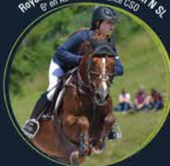
Royal Aronn du Vassal, par Aron N SL 6 e en As Elite Excellence CSO