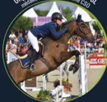
Ungaro of Qofanny, par Linaro SL médaillé d'argent en As Elite CSO