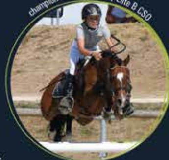
Very Star Kervever SL champion de France Poney Elite B CSO