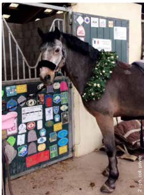
2 - ph. coll. privée