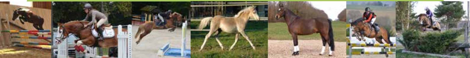
Sir Raspoetin Tilia - Blue Tinka Tilia - Alaska du Tilia - Greatstar Embet Tilia - Movie Star Tilia - Le Look Tilia - Tango Charly Tilia

Blup Set l'Echeneau , issue de la souche de Springbourne Ladybird, fut 5° du championnat de France B1 Elite CSO (IPO 148) et possède 8 produits, dont 7 sont indiqués, à l'image de l'étalon Tango Charly Tilia (par Hondsrug Raspoetin SL, P1 CSO, P Elite CCE, IPC 126/16, IPD 118/12 et IPO 115/13), Real Indoctro Tilia (f, par C Indoctro, As Poney 2D CSO, IPO 122/16, désormais poulinière à l'élevage du Vassal) ou encore Set Up Tilia (f, par Hondsrug Raspoetin SL, IPO 123/14). Sa fille poulinière Queen Sympatico Tilia a produit 2 étalons, 2 championnes de France de 2 ans Pfs, une vice-championne de France foal femelle Pfs et 2 poneys indiqués à plus de 120.