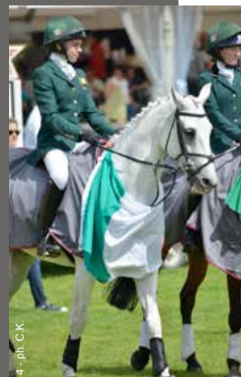
4 - ph. C.K.

« Il y a des poneys sans origines connues à tous les niveaux, sans que cela ne pose de problèmes » explique Valérie Gateau, « en fait, souvent, les éleveurs prennent juste la décision