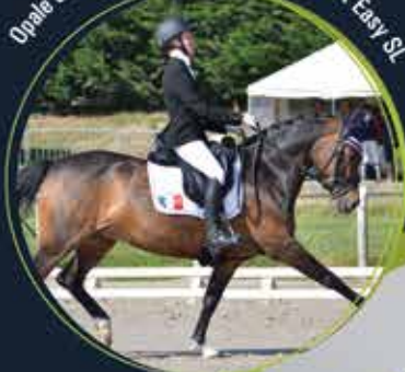
Opale des Vents* Les félins, par Teake It Easy SL 6 e en As Elite Dressage