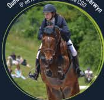
Quolibri de l'Étivant, par Machno Carwyn 8 e en As Poney 1 Excellence CSO