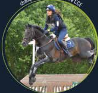
Mon Nantano de Florys SL champion de France As Elite CCE